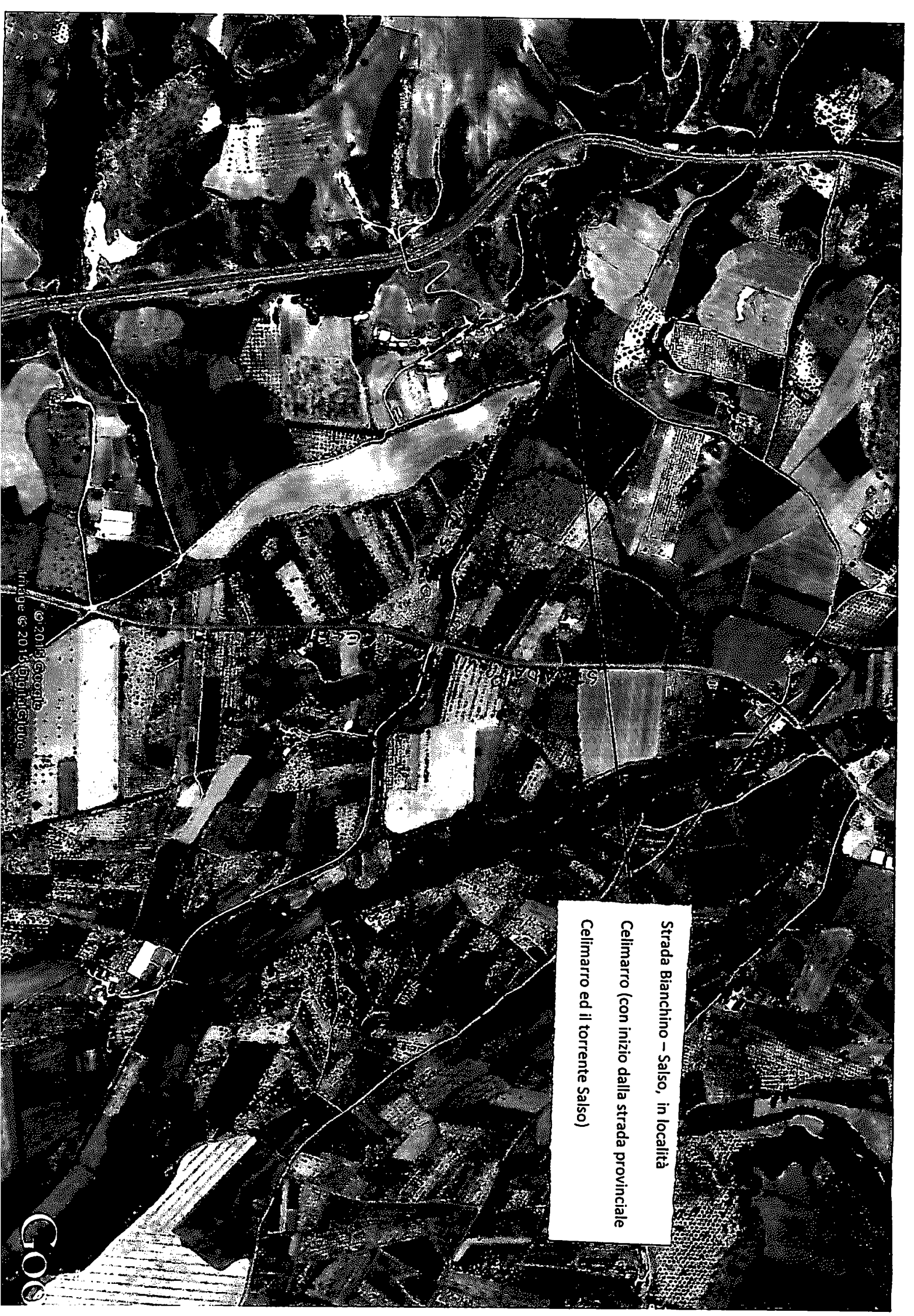
Strada Bianchino – Salso, in località Celimarro (con inizio dalla strada provinciale Celimarro ed il torrente Salso)